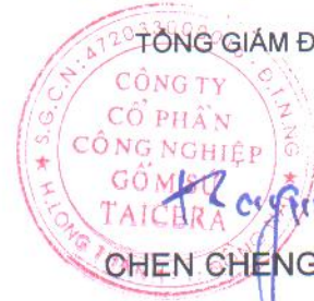
CHEN CHENG JEN